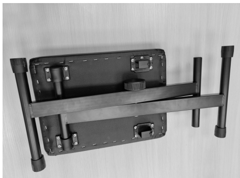
1. Распакуйте стул

Обе модели стульев уже собраны. Необходимо установить их в устойчивое положение: