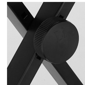
4. Винт регулировки высоты

Для регулировки высоты стула открутите крепежный винт (рис. 4), установите одно из трех положений высоты и закрутите винт обратно.